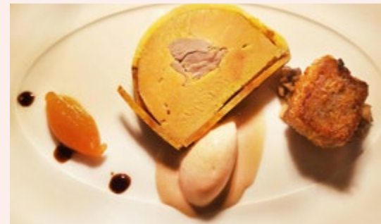
Gebackener Kalbskopf, Entenleber und Quitte