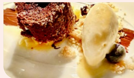
Schokoküchlein mit Mangochutney und Eierlikör

mig-flüssigen Köstlichkeiten. Zunächst wurde ein Klecks Trüffelmayonnaise auf das Pergament gegeben, gefolgt von Rote-Bete-Extrakt, Parmesan-Crumble und Tomatencreme. Eine Linie Avocadojus sowie kunstvolle Spritzer von Balsamico rundeten dieses essbare Kunstwerk ab. Dazu wurden Roggenbrot und Sesambrötchen serviert. Nun blieb jedem Gast selbst überlassen, ob er die einzelnen Komponenten bewusst nacheinander genießen oder alle Aromen gemeinsam aufnehmen wollte. Bereits dieser Auftakt trug unverkennbar die Handschrift des Hauses.