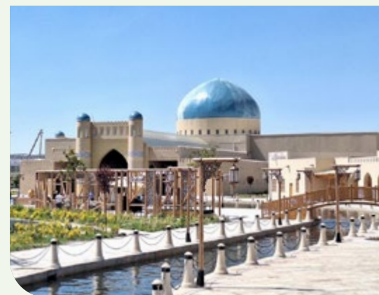
Das historische Xiva

Mobilität und der wirtschaftlichen Entwicklung beitragen.