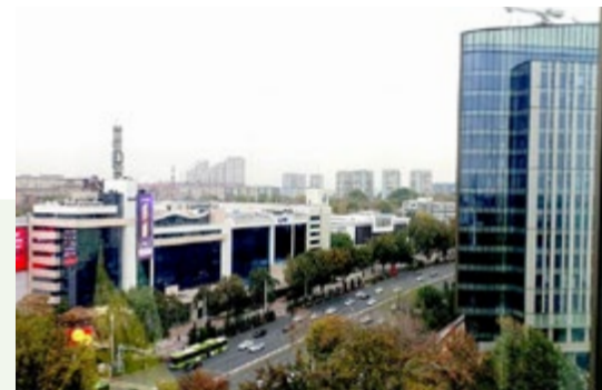
Blick auf Taschkent

Der Zug stärkt die Eisenbahnverbindung zwischen Taschkent und dem historischen Westen Usbekistans. Die Route kann den Personenverkehr erleichtern, aber auch zur Förderung des Tourismus, der regionalen