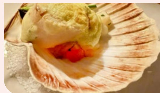
Gratin von der Jakobsmuschel mit Spargel und Morcheln