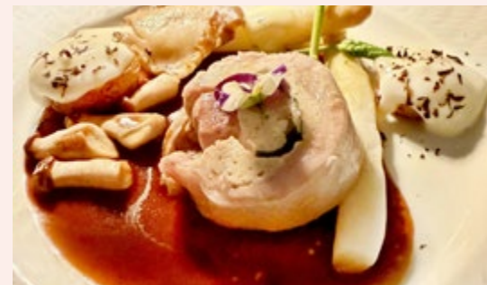
Stubenküken mit Spargel, Morcheln und Trüffelkartoffeln