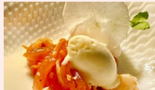
Thunfisch-Supreme mit geistem Beef Tea und Wasabi