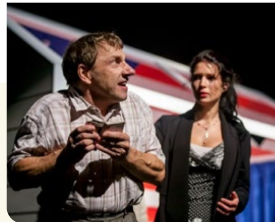
Hauptdarsteller Richy Müller gibt sein Dresden-Debüt in der Rolle des Raymond

Die Geschichte zweier ungleicher Brüder, die auf einer unfreiwilligen Reise zueinanderfinden, entfaltet in der direkten Bühnennähe eine neue emotionale Wucht. Und das dann so extrem, dass es einem auf der Heimfahrt mit dem Gedanken an das Gesehene, insbesondere an die Figur des Rain Man und wie diese von Müller umgesetzt wurde, schon ein bisschen fröstelt und gruselt.