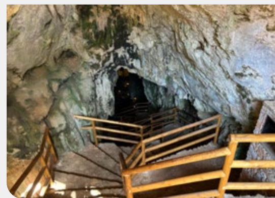
Abstieg zur Melidoni-Höhle

Höhepunkt erfuhr sie, als 1824 die Türken rund 360 Einwohner, die sich ihnen nicht ergeben wollten und mehrere Monate in