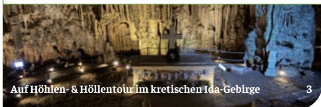
Auf Höhlen- & Höllentour im kretischen Ida-Gebirge 3