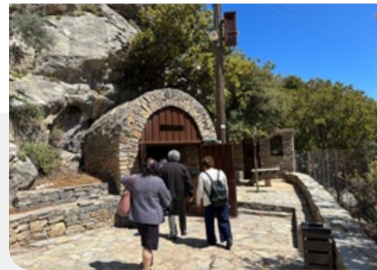
Eingang zur Sfentoni-Höhle

Die zweite (Tropfstein-)Höhle ist die Melidoni-Höhle oberhalb des Bergdorfes Melidoni. Wie schon bei der Sfentoni-Höhle empfiehlt es sich, Google-Maps zu nutzen – denn an der Ausschilderung fehlt es leider des Öfteren. Diese Höhle ist für Gehbehinderte nicht geeignet, gibt es doch viele Stufen und Treppen auf dem Weg ins Innere. Wer sich vorher nicht darüber informiert hat, wird überrascht sein von der Größe der Heldenkammer, eine der größten Höhlenhallen Griechenlands. Im Gegensatz zu Sfentoni kennt man die Melidoni-Höhle schon über 500 Jahre länger. Bereits 1445 wurde sie als Hermes-Heiligtum verehrt. Später wurde sie auch als Wohnraum genutzt. Ihren negativen